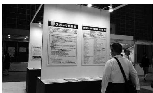
ブースを訪れた人々は、興味深そうにパネルに見入っていた