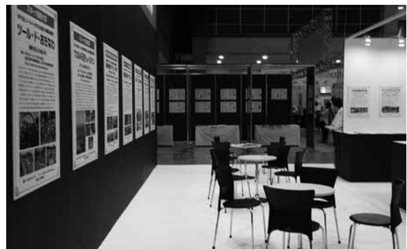
開場前のブース内レイアウト