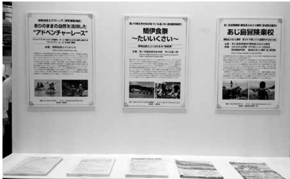
惜しくも受賞は逃したが、工夫あふれる応募者の取り組みも紹介した