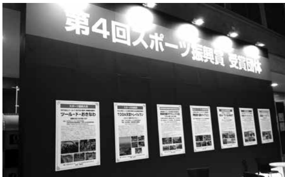
本連合会のブース。大きなパネルで各受賞者の取り組みを詳しく紹介