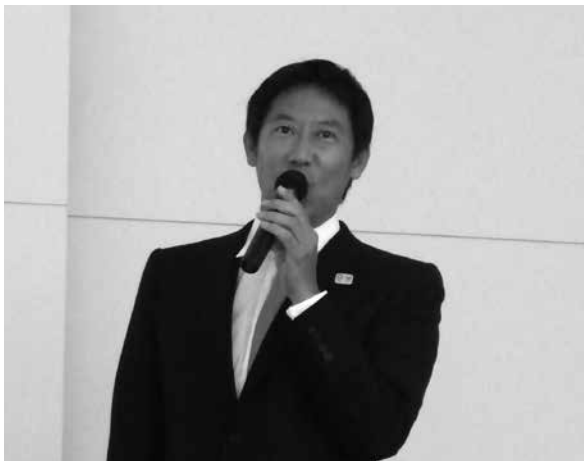
鈴木大地氏。ときおりジョークも交え、会場を盛り上げた

長官、次長、審議官、スポーツ総括管などを筆頭に130名ほどのメンバーから成り立つスポーツ庁のミッションは、大きく次の4点だ。①スポーツによる健康増進、②国際競技力の向上、③国際的地位の向上、④スポーツによる地域経済の活性化、⑤学校などにおける子どものスポーツ機会の充実。とくに①については、国民を健康にし、年々増え続ける医療費を抑えるためにも、とても重要となる。このままでは、数年後の医療費は50兆円を超えともいわれているためだ。2015年の調査では、成人で週に1回運動している人の割合が約40%であったが、スポーツ庁では、これを2021年までに65%にまで引き上げることを目標に掲げている。官庁でも、2016年7月11日、いつもより業務開始時間を1時間繰り上げ、業務終了後に皆でジョギングやボルダリング、卓球など、いくつかのチームに分かれてレクリエーションを実施したという。同様の動きが、全国に広がっていくと面白いだろう。