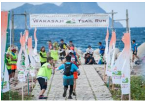
若狭路スポーツトリップ

一般社団法人若狭路活性化研究所 (福井県三方上中郡若狭町) http://wakasaji-ari.com/